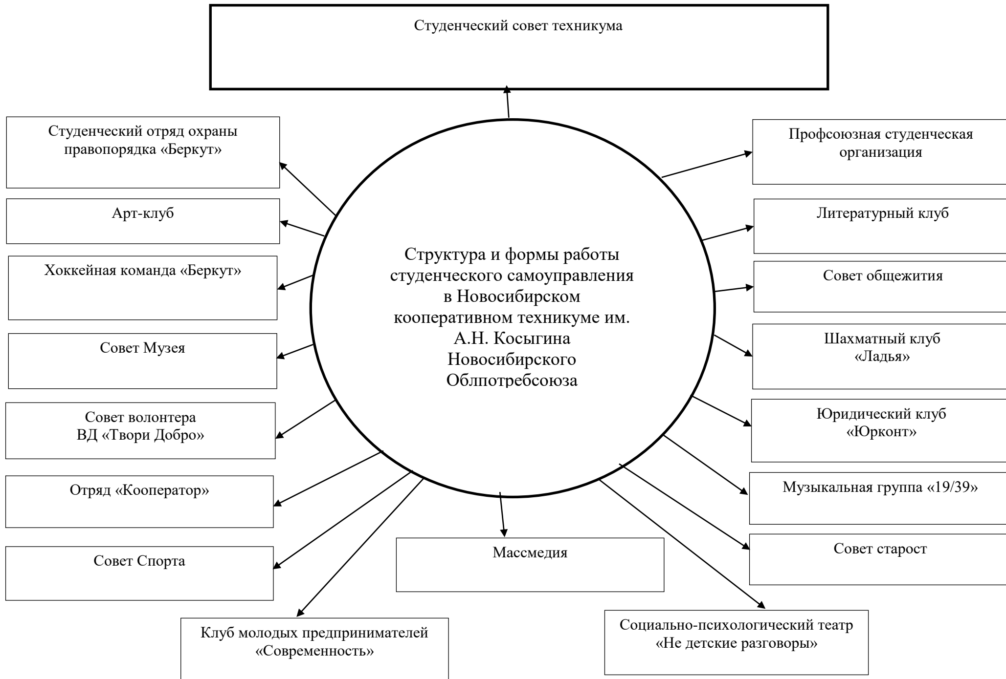
Рис. 1. Формы студенческого самоуправления