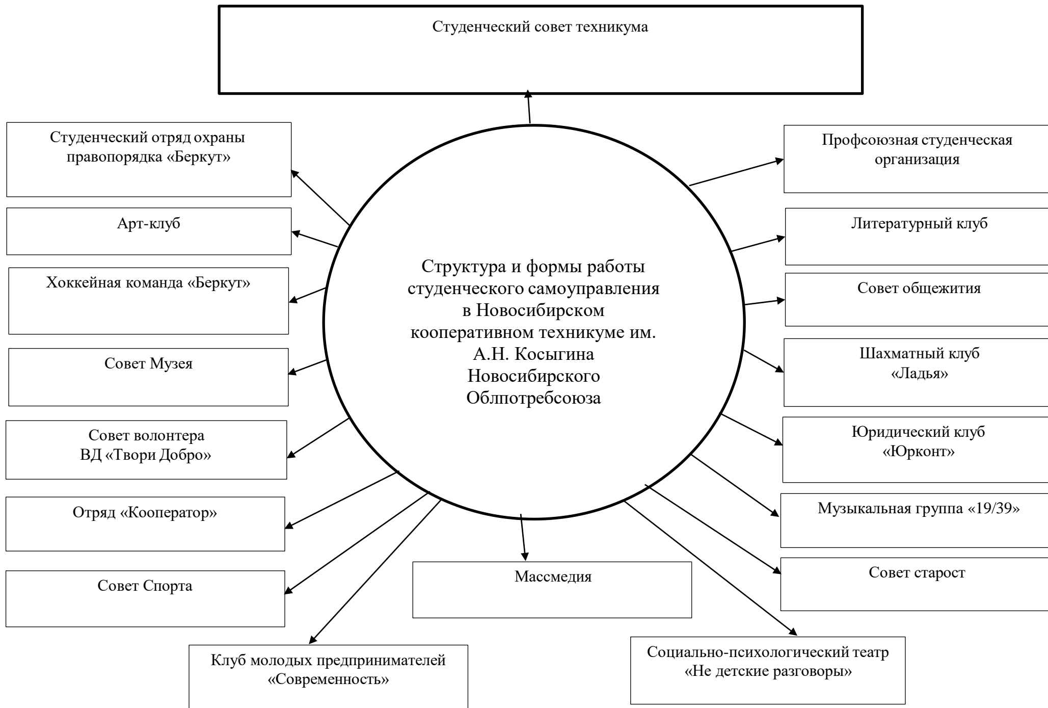
Рис. 1. Формы студенческого самоуправления